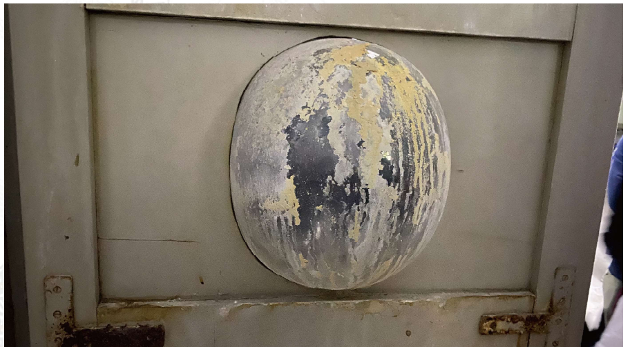
休養區內「號房」門上之監視窗