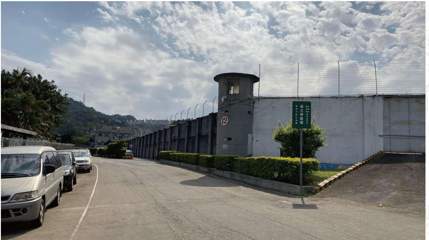
原國防部臺灣軍人監獄，現為法務部矯正署新店戒治所