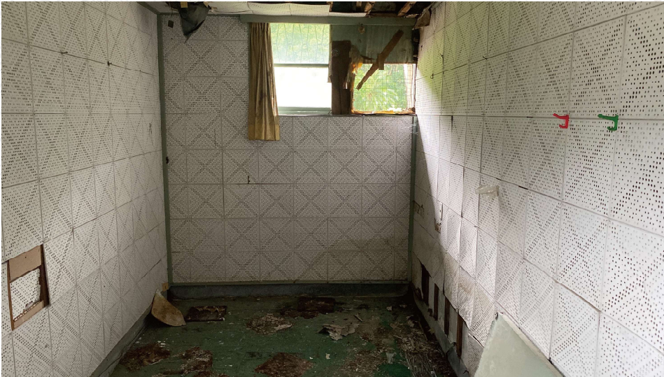
工作區內「小型偵訊室」之樣貌 拍攝 | 2020年暗坑文化工作室

據被調查人口述，當他們被捉捕並載往安康接待室的過程中，因為雙眼被矇上布條或布袋，因此無法看見外部環境，在此處看見外面時就已經身處這個房子內，這就是偵訊室及部分辦公空間所載的「工作區」。