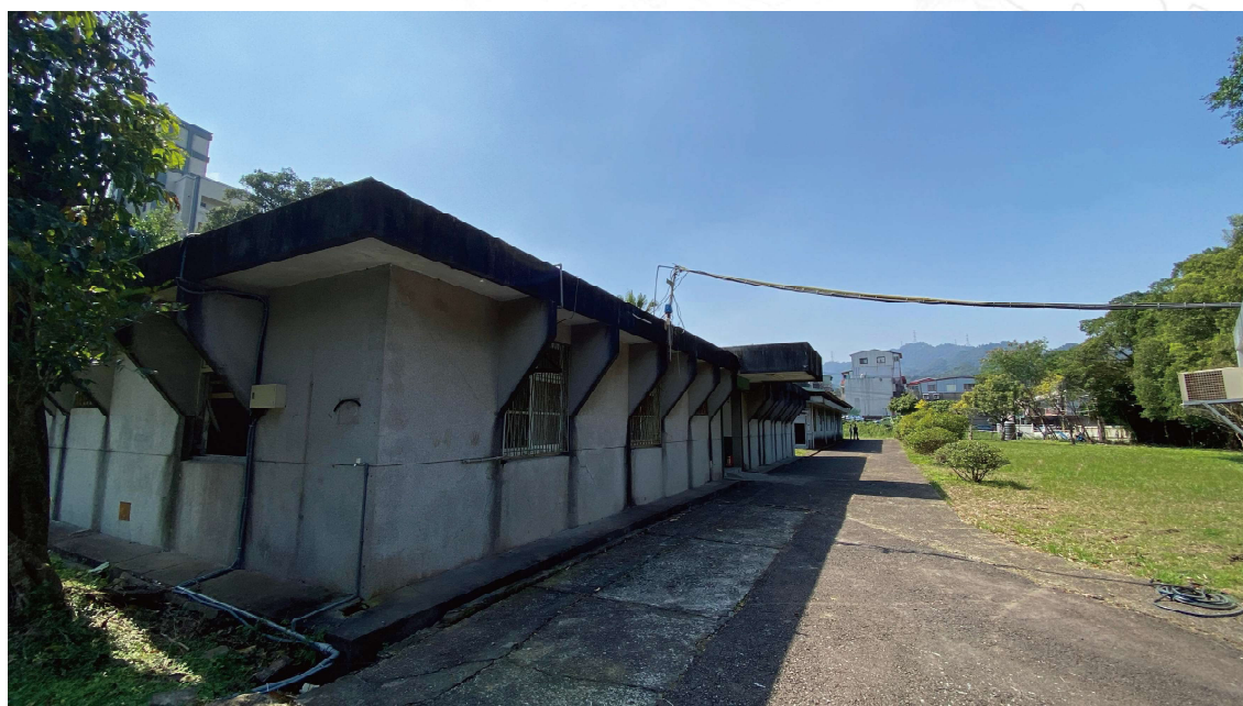
安康接待室外觀

黃信介 施明德 姚嘉文 張俊宏 陳菊 王拓 陳忠信 周平德 林宏宣 蔡有全 蘇黎慶