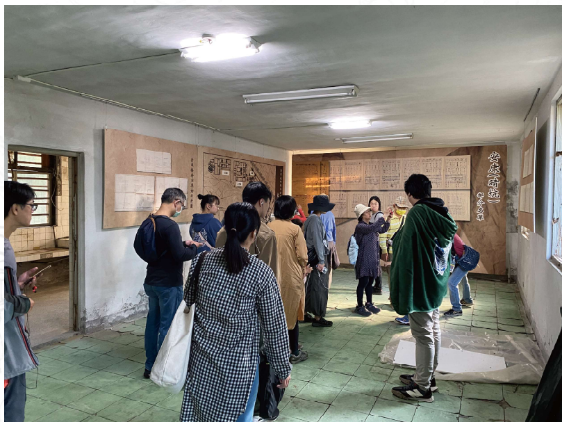
生活區內「餐廳」之現況

位於工作區西側，為一長條型平房，做為調查局基層工作人員所住宿空間，早期設有閱覽室，但後來一改為宿舍空間使用，每一間房間均為套房。