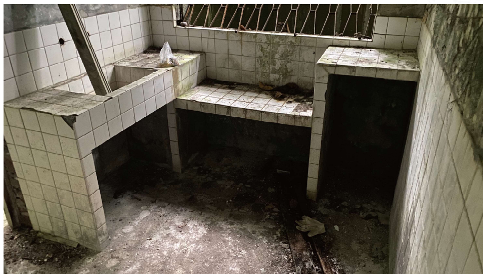
宿舍內「廚房」之樣貌

位於休養區南側，其為一棟兩戶型建築，因其居住空間相當寬敞且具備兩間房間，推測為主管所居住之空間。