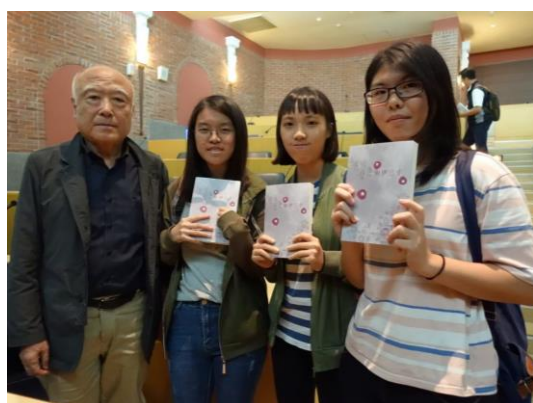
學生假日自行參與玄基榮演講