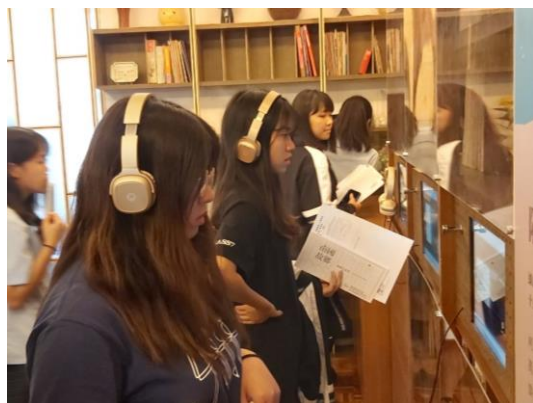
上課情況（參訪柯旗化故居）