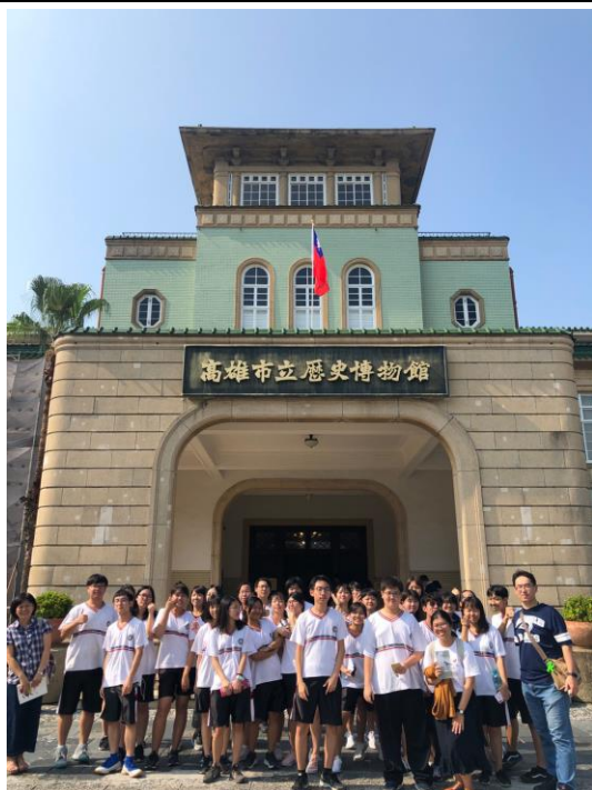
上課情況（參訪高雄市立歷史博物館）