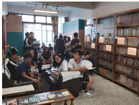
上課情況（參訪柯旗化故居）