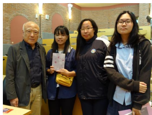
學生假日自行參與玄基榮演講