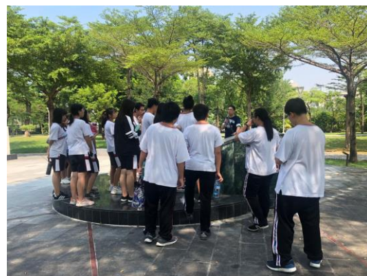
上課情況（參訪二二八和平紀念公園）