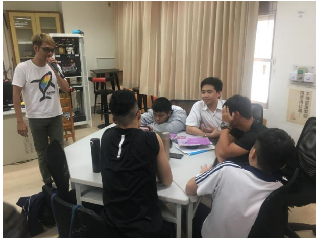
(學生討論使用電子產品管理規範：分組討論適合本校的管理規範)