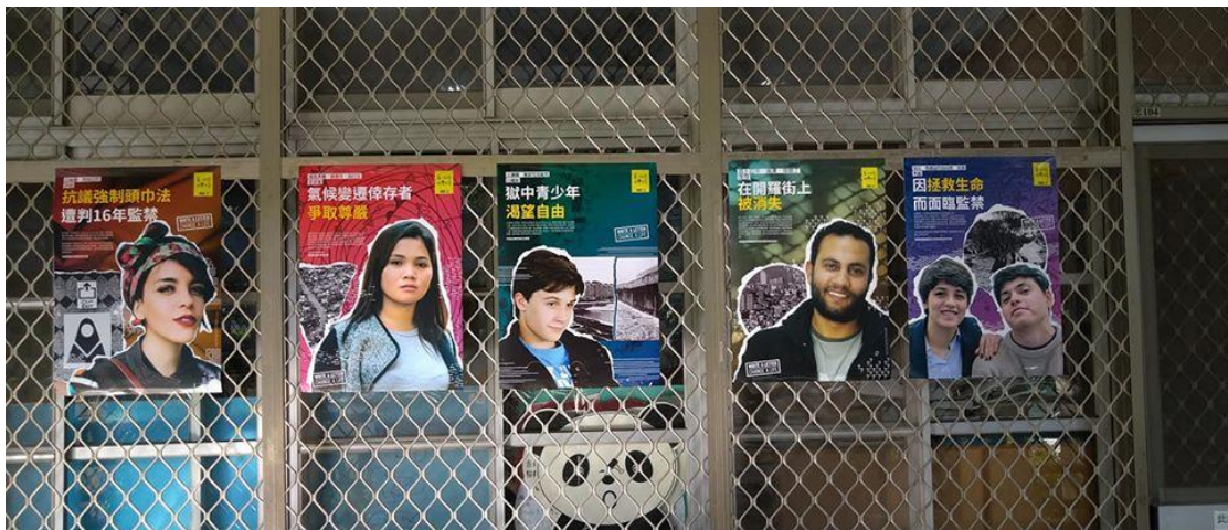
(2019年寫信馬拉松活動)