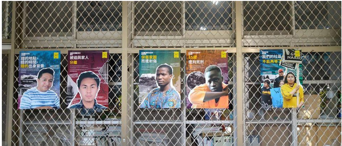
(2019 年寫信馬拉松活動)

或白色恐怖時期為背景之影片，由學生為劇中角色進行人物測寫後，再由學生演出一小段劇情，老師詢問角色的心境，藉此讓學生身歷其境、融入故事場景。