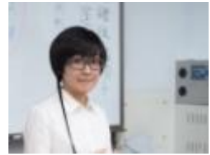
沙龍珈琲 x 文化實驗室