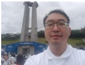
台中市立文華高中