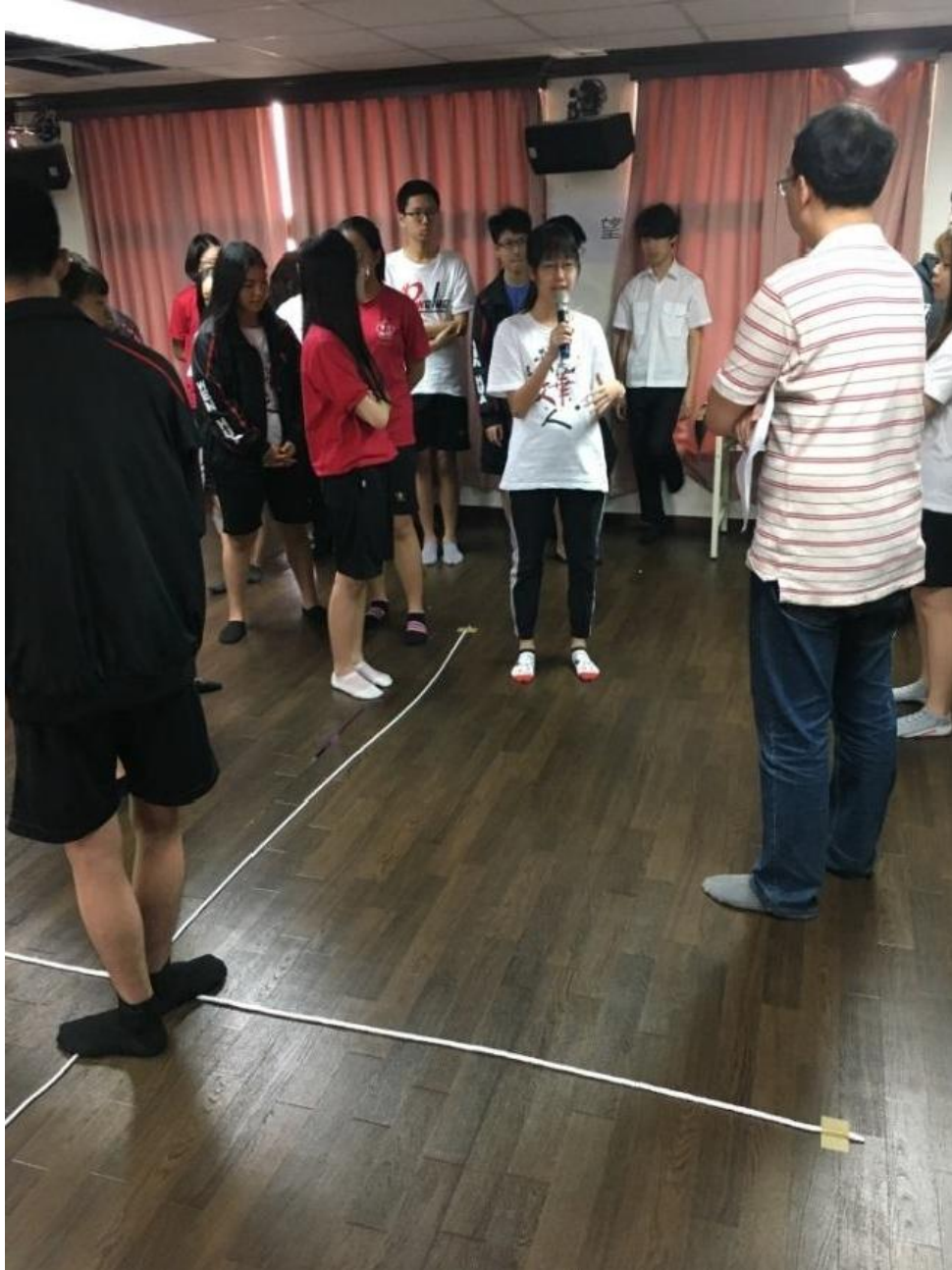
(《探索城市黑暗歷史：紐倫堡》· 矩陣法)

象化」。於是，如何讓學生感同身受，進而相信歷史是充滿人性且活生生不斷重現、甚至是存在在自己身邊的，這是我們設計這個課程的初衷。