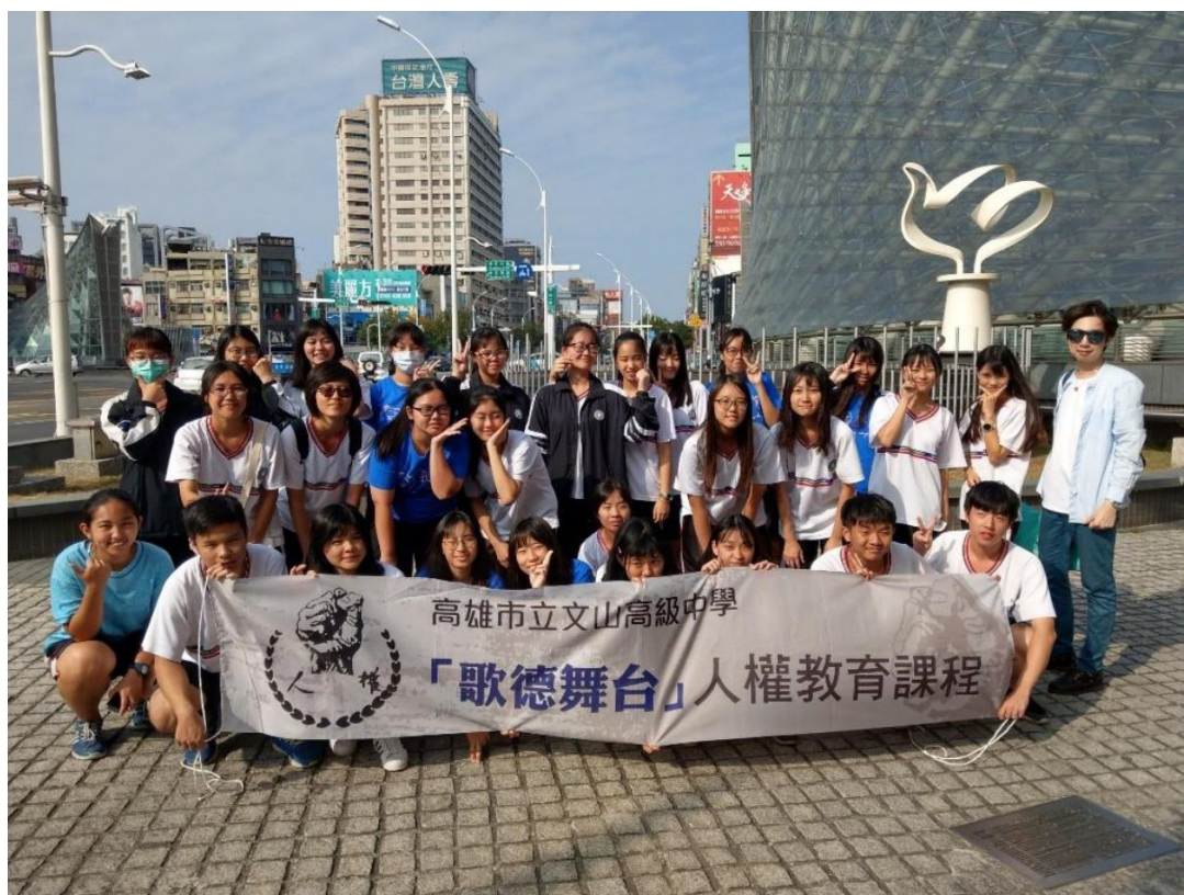
▲重返案發現場，踏查美麗島雜誌社遊行路線。途經原美麗島雜誌社高雄服務處、大港埔圓環、原高雄市警察局第一分局（今新興分局）、促進和平維護人權紀念碑、美麗島大道（中山一路），以及原扶輪公園（今中央公園言論廣場）。此圖為教師與學生在新興分局前與人權紀念碑合影。

教師挑選出與美麗島事件相關的七個事件，並且準備七張白紙，每張紙呈現一個事件。紙張正面為事件的說明，背面是相關歷史照片，無論正反面皆有空格及問題。學生必須經由分組討論、資料查詢完成事件的空格及問題，再依照發生過程將順序排列出來，完成時序脈絡。藉由文本的重組，重新排列歷史時序，將七個事件完成一場美麗島運動的重組脈絡化。