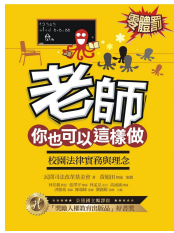
書《老師你也可以這樣做》