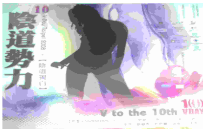
圖為2008台北市vday活動海報部份剪影