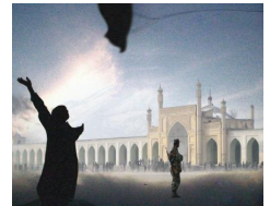
加台人權影展在新竹、高雄。

★ 樂生故事館導覽活動 -樂生故事館已於2007年12月12日起正式開館，歡迎 預約導覽!