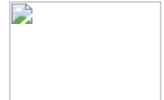
法治教育向下紮根教學紀錄片頒獎剪影

對於電子報刊載的內容及文章有想法及意見的話，歡迎與我們聯絡 natali.huang@lre.org.tw 或網站 http://hre.pro.edu.tw