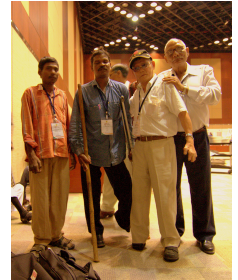
台灣樂生保留自救會受邀至印度參加世界漢生大會

1月29日至2月4日在印度海德拉巴城隆重開幕。本次會議由印度政府及世界衛生組織,ILA,I LEP,LIA,IDEA等國際組織主、協辦。這次會議雖然台灣政府無法參加，台灣民間的醫療NGO與宗教社服等機構亦未能參與，但是令人驕傲的是樂生保留自救會及IDEA Taiwan (國際愛地芽協會台灣分會)代表受邀，..... 詳細全文