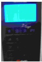
數位證件專用讀卡機