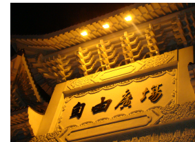
公民有不受政府無正當理由干擾的自由