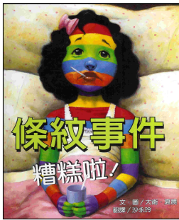
書《條紋事件糟糕啦!》