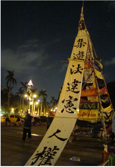
圖為野莓學運所製作的野莓塔，主要訴求在呼籲政府修改集會遊行法，落實民主國家中的言論自由。