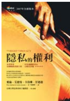
書《隱私的權利》