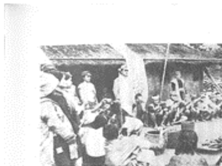
高砂商會民化運動進行圖

以當時的年齡青年到臺灣來，是抱著對新世界的嚮往的。高砂商會民化運動（以下簡稱「民化」）青年團，是當時最活躍的組織。當時的民化運動，是透過各種形式的教育，讓台灣人了解日本文化，並學習日語。民化運動的推行，是當時日本政府為了加強對台灣的統治而採取的一項重要政策。民化運動的推行，不僅是為了提高台灣人的日語水平，更是為了灌輸日本的價值觀和忠君愛國的思想。民化運動的推行，是當時日本政府對台灣進行同化政策的重要組成部分。民化運動的推行，是當時日本政府為了加強對台灣的統治而採取的一項重要政策。民化運動的推行，不僅是為了提高台灣人的日語水平，更是為了灌輸日本的價值觀和忠君愛國的思想。民化運動的推行，是當時日本政府對台灣進行同化政策的重要組成部分。