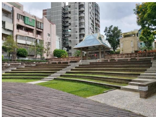
廣場前可立即演出