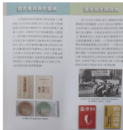
從紀念館的小冊子中設計學習單