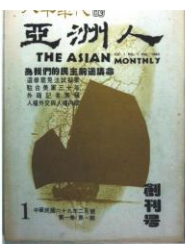
■1980年2月《亞洲人》雜誌創刊。