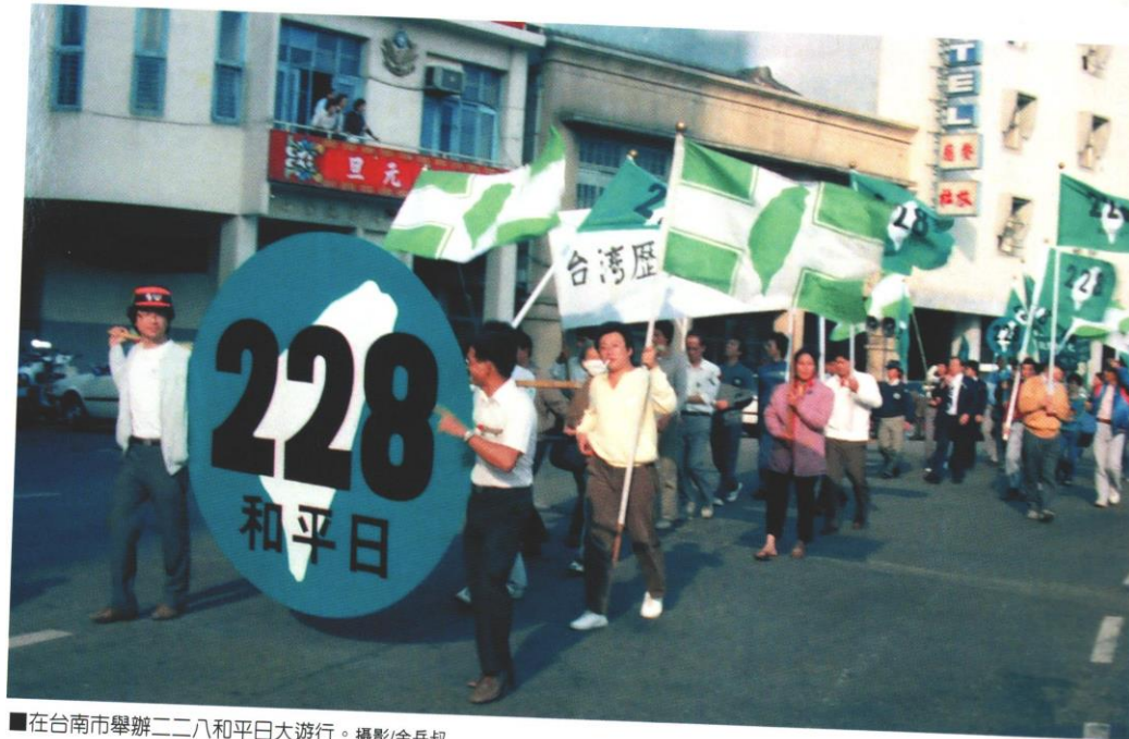
■在台南市舉辦二二八和平日大遊行。