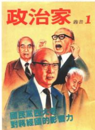
■1981年2月《政治家》半月刊雜誌創刊。