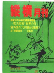
■1981年2月《縱橫》月刊雜誌創刊。