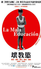
電影《Bad education》