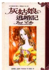
書《灰姑娘逃婚記》 來源:博客來網路書店

但是隨著國際交流，人權的發展也形成了普世的價值。第二次世界大戰以後，人權問題益為人所重視，不僅在各國國內成為評斷民主政治、經濟生活與社會發展的指標，同時也是國際之間衡量一國開發水準的尺度。一九四八年十二月十日，聯合國通過「世界人權宣言」，迄今已逾半世紀的歲月，人權的觀念與實質，基本上已獲世界各國政府及人民所認同。..... 詳細全文